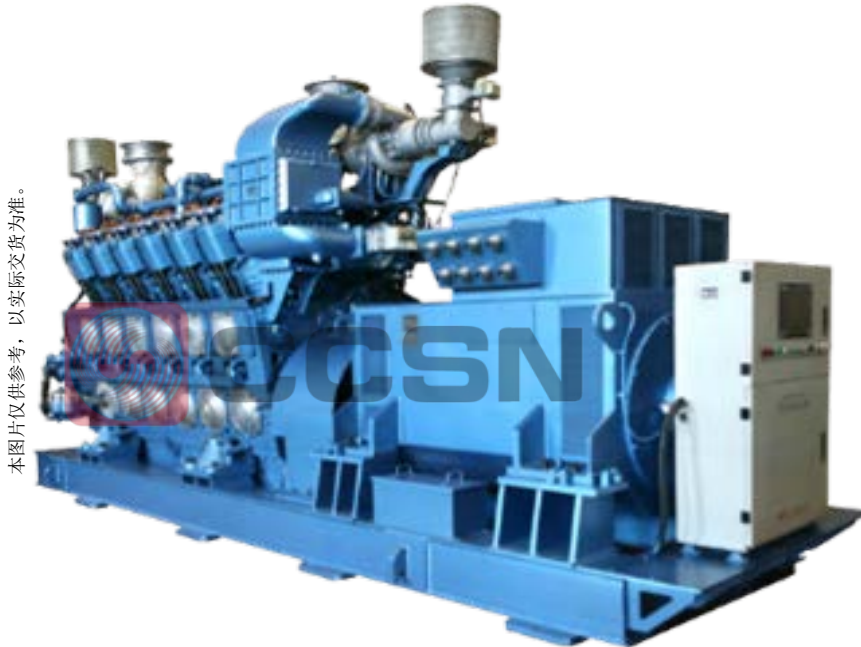
本图片仅供参考，以实际交货为准。

功率因数 0.8 滞后 | 1000\text{min}^{-1} | 50Hz | 3 相 4 线 | 额定电压 6.3/10.5kV 常用功率 备用功率 1637kWe/2046kVA 1800kWe/2250kVA